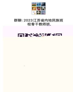
培训班微信二维码